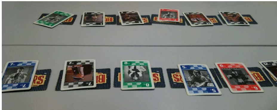
カードの配置方法